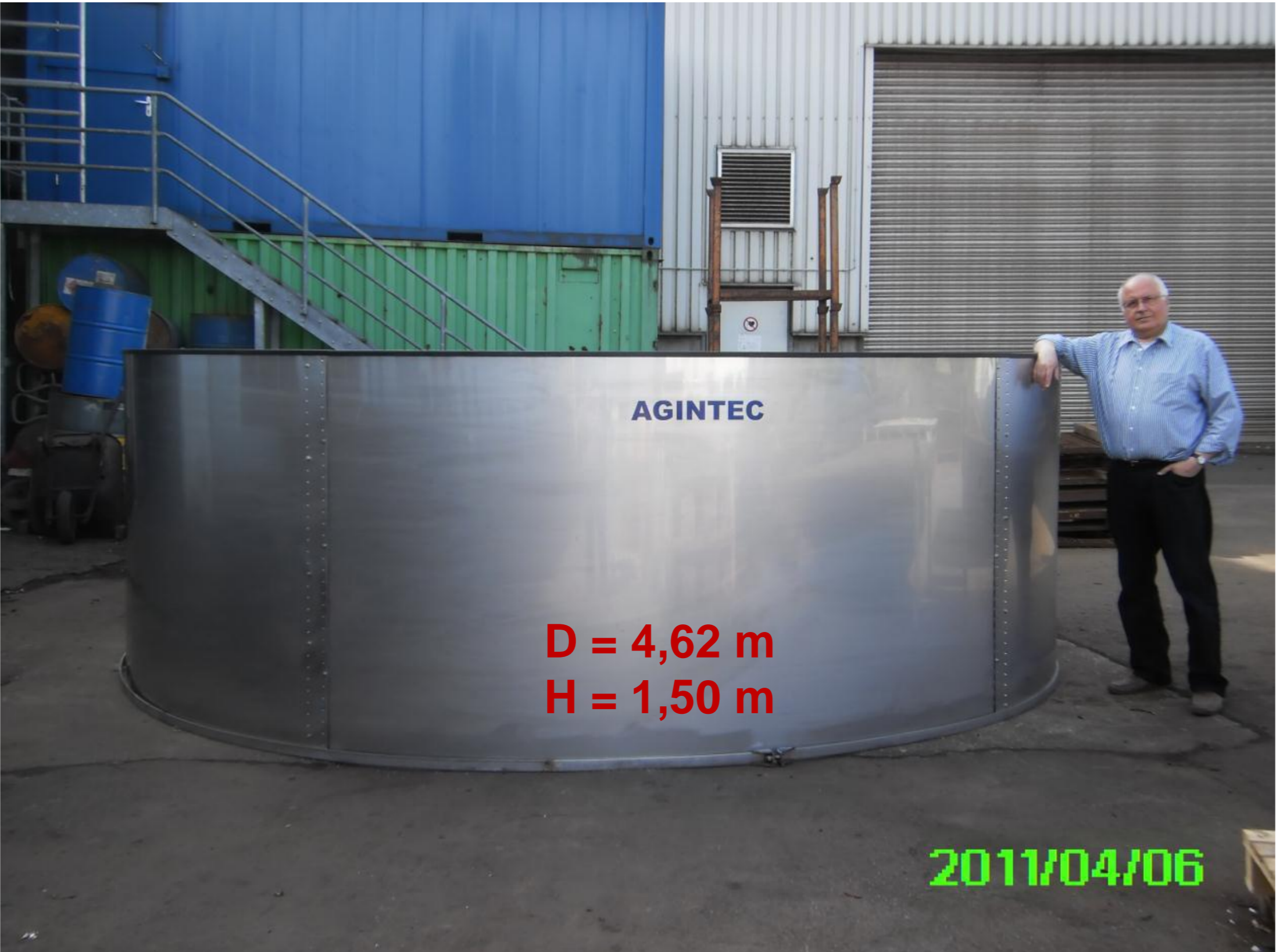
IRAS M 19

Vermarktung permanent Lebendfrische Fische aus transparenter, kontrollierter Produktion