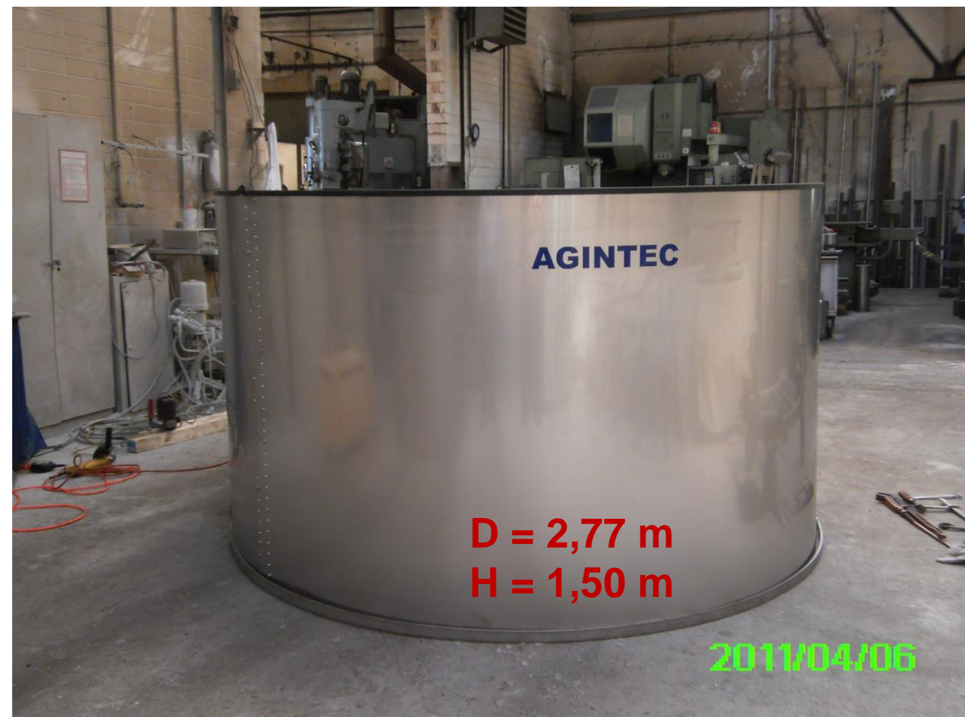
IRAS J 6

Jungfische 200 – 500 g Neubesatz bis 6 mal jährlich