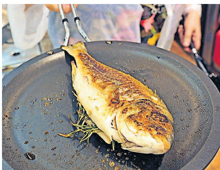
Doraden aus Völklingen schaffen es offensichtlich nicht in die Pfannen der saarländischen Gastronomie.

Der Preis ist neben dem Vertrieb auch ein kritisches Thema: „Die Fische aus Völklingen sind schlicht und einfach zu teuer“, sagt Jürgen Becker vom