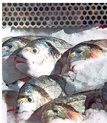
Der Völklinger Fisch beschäftigt nun einen Untersuchungsausschuss im Landtag.

Obwohl CDU und SPD der Einberufung des Untersuchungsausschusses zustimmten, stellten ihre Vertreter den Sinn eines solchen Gremiums in der gestrigen Landtagsdebatte in Frage.