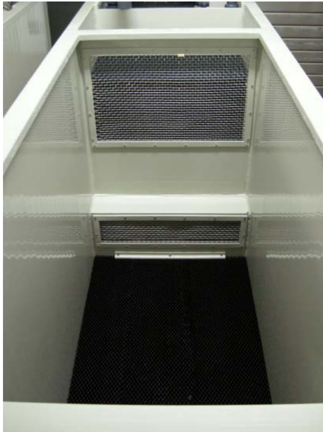
Becken ohne Wasser mit Denitrifikation am Boden