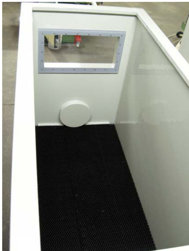
Kontrollfenster und Fischschleuse