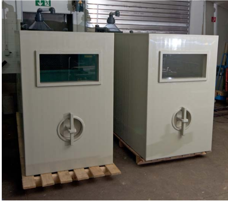
IRAS Twin versandfertig Das linke Becken ist voll mit Wasser. Optimale Statik dank Hohlkammerplatten